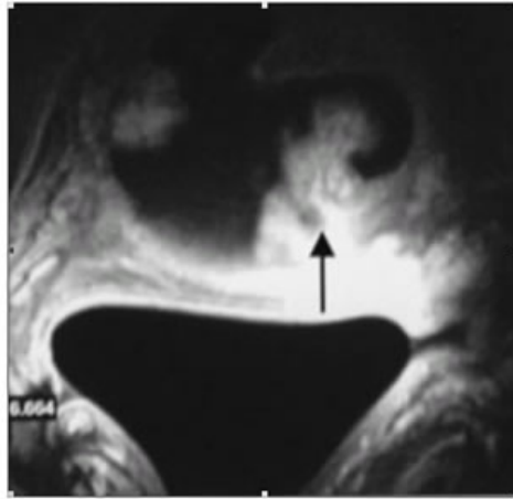
Fig. 4 : Adénocarcinome urétéral développé dans un diverticule étudié en IRM A : image pondérée T2 B : image pondérée T1 après injection Gadolinium