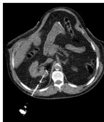
DTP lésion rénale sous scanner